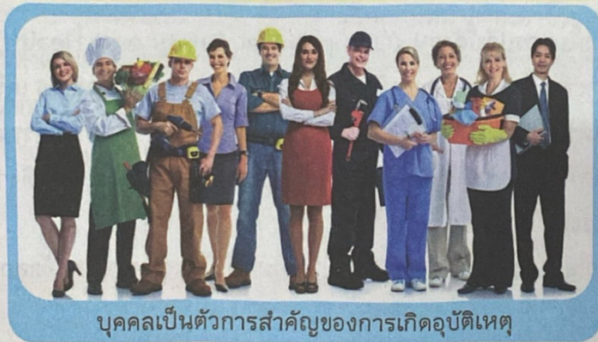
บุคคลเป็นตัวการสำคัญของการเกิดอุบัติเหตุ

◆ บุคคล คือ ผู้ปฏิบัติงาน ซึ่งเป็นตัวการหลักของการเกิดอุบัติเหตุ จากสถิติของการเกิดอุบัติเหตุพบว่าส่วนใหญ่เกิดจากการกระทำที่ไม่ปลอดภัยของบุคลากรผู้ปฏิบัติงาน ที่ขาดความรู้ ความเข้าใจ ประสบการณ์ และความชำนาญ รวมถึงการที่ผู้ปฏิบัติงานมีสภาพที่ไม่พร้อมทั้งทางร่างกาย เช่น อดนอน การเจ็บป่วย การเหน็ดเหนื่อย และสภาพที่ไม่พร้อมด้านจิตใจ มีความทุกข์ เหม่อลอย เหล่านี้ล้วนส่งผลให้เกิดความผิดพลาดในการปฏิบัติงานได้ เพื่อเป็นการป้องกันการเกิดอุบัติเหตุ จึงควรมีการอบรมปลูกจิตสำนึกที่ดีด้านความปลอดภัย ชี้ให้เห็นถึงสาเหตุที่จะก่อให้เกิดความไม่ปลอดภัย ผลเสียที่เกิดขึ้นหากไม่ระมัดระวัง ตลอดจนฝึกฝนให้ผู้ปฏิบัติงานมีความชำนาญในการปฏิบัติงานที่ตนเองรับผิดชอบ นอกจากนี้หน่วยงานของรัฐจะต้องมีส่วนเกี่ยวข้องกับความปลอดภัยในการปฏิบัติงานและการมีข้อกำหนดให้ปฏิบัติตาม หรือให้ปฏิบัติตามกฎหมายความปลอดภัยอย่างเคร่งครัด