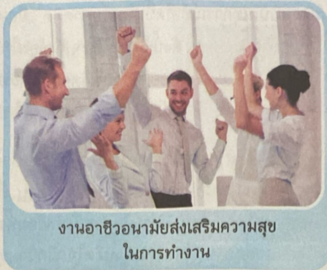
งานอาชีพอนามัยส่งเสริมความสุข ในการทำงาน