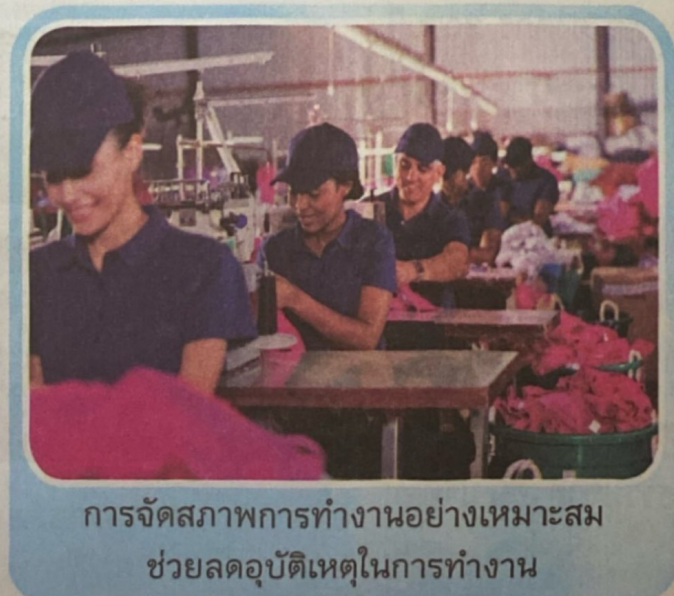
การจัดสภาพการทำงานอย่างเหมาะสม ช่วยลดอุบัติเหตุในการทำงาน

ความปลอดภัยในการทำงานเป็นหัวใจสำคัญของการปฏิบัติงาน หากมีการจัดสภาพการทำงานอย่างปลอดภัย จะทำให้ปราศจากการเกิด “อุบัติเหตุ” ในการทำงาน