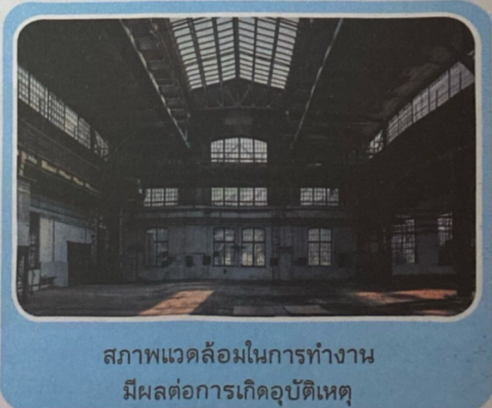
สภาพแวดล้อมในการทำงาน มีผลต่อการเกิดอุบัติเหตุ

◆ สภาพแวดล้อม คือ องค์กร สถานที่ทำงาน หรือโรงงานที่ปฏิบัติงาน จากสถิติการเกิดอุบัติเหตุในการทำงานพบว่าสภาพแวดล้อมในการทำงานเต็มไปด้วยอันตรายต่าง ๆ เช่น อากาศถ่ายเทไม่สะดวก การวางผังโรงงานไม่ดี การก่อสร้างหรือการต่อเติมไม่ได้มาตรฐาน ไม่มีเครื่องหมาย สัญลักษณ์การเตือนภัย ทั้งนี้รวมถึงสภาพแวดล้อมทางธรรมชาติ เช่น น้ำท่วม ฝนตกหนัก ไฟฟ้าด้วย